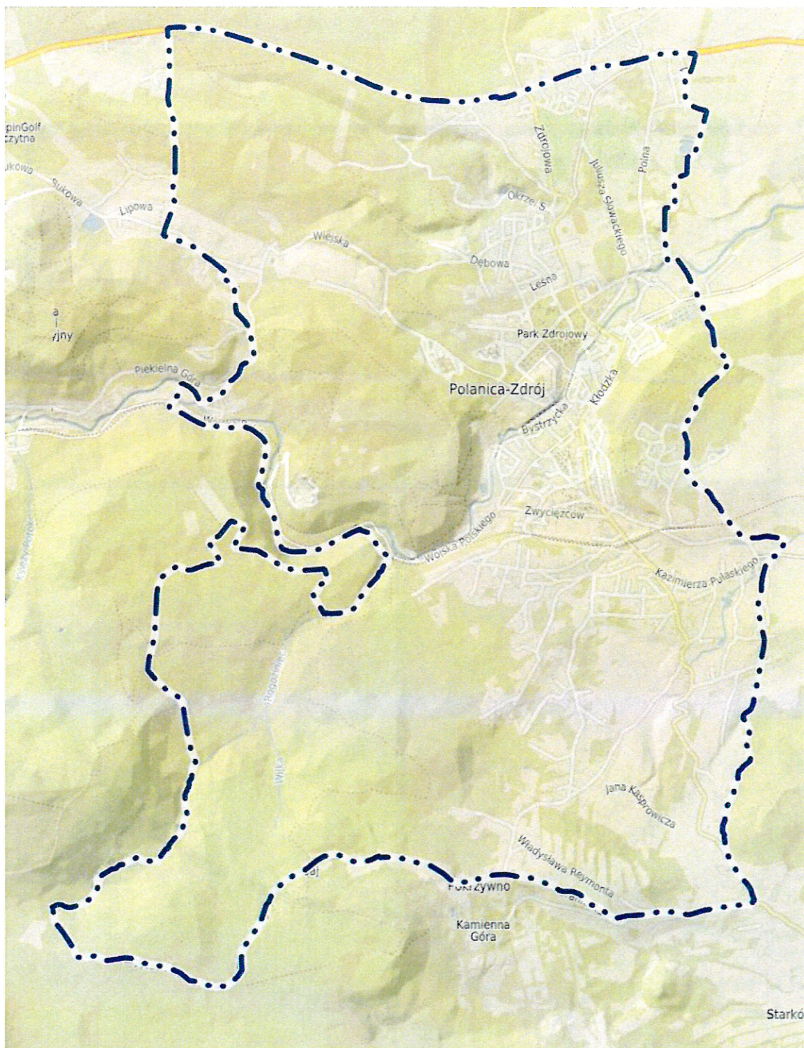
Granice terytorialne Miasta Polanica - Zdrój

Załącznik nr 1 do Uchwały nr XI/77/2018 Rady Miejskiej w Polanicy – Zdroju z dnia 5 października 2018 r.